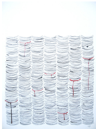
© Claire Le Pape - Sans titre (tapisseries) , 2008