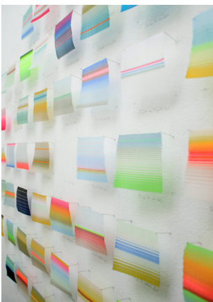
© Claire Le Pape - 52 semaines , 2015/2016